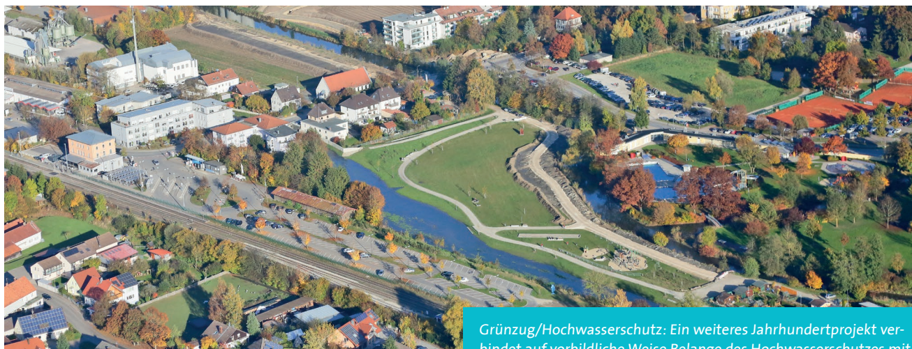
Grünzug/Hochwasserschutz: Ein weiteres Jahrhundertprojekt verbindet auf vorbildliche Weise Belange des Hochwasserschutzes mit naturnahen Freizeit- und Erholungsmöglichkeiten an der Paar.