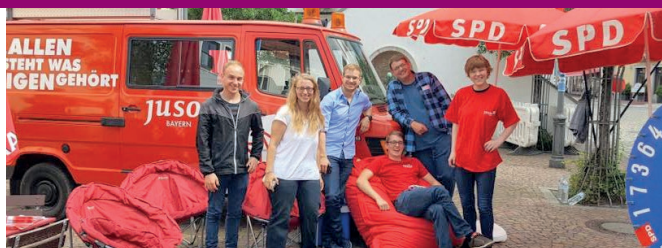
Die Jugendorganisation der SPD kämpft mit unverbraucher Kraft, junglichem Elan und vielen neuen Ideen für linke Politik und Überzeugungen.

Gut 50 Veranstaltungen haben die Jusos aus Aichach und Aichach-Friedberg in den vergangenen vier Monaten absolviert. Egal ob Seminare zum sozialen Wohnbau, eine Demonstration gegen den rechtspopulistischen Kopp-Verlag oder Veranstaltungen zur Gestaltung unserer gemeinsamen Heimat: die Jungsozialisten in der SPD sind immer mit dabei!