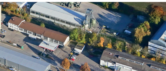
Bahnunterführung: Die Beseitigung des höhengleichen Bahnübergangs bei Algertshausen löst ein uraltes Verkehrsproblem in Aichach. Bald kann der Verkehr hier ungehindert fließen.