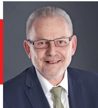
Klaus Habermann, Erster Bürgermeister, Stadt Aichach